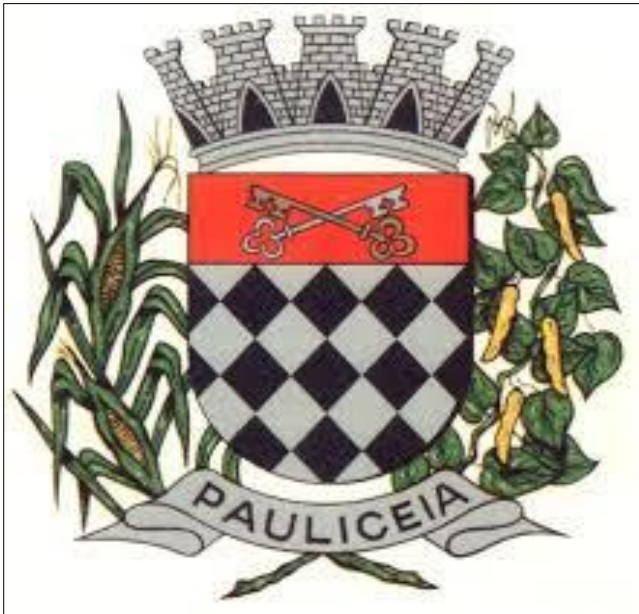
PREFEITURA MUNICIPAL DE PAULICÉIA-SP